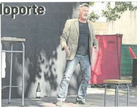
Il est parvenu à braver les vents et les pluies en se tenant debout sur une chaise en plein air.

« J'ai fait un grand séjour, au sein d'une grande équipe et sur plusieurs années. J'ai travaillé à Bruxelles, à Paris, à Chalon. J'ai rencontré des personnes très intéressantes. C'est toujours agréable de rencontrer de nouvelles personnes. C'est toujours agréable de rencontrer de nouvelles personnes. »